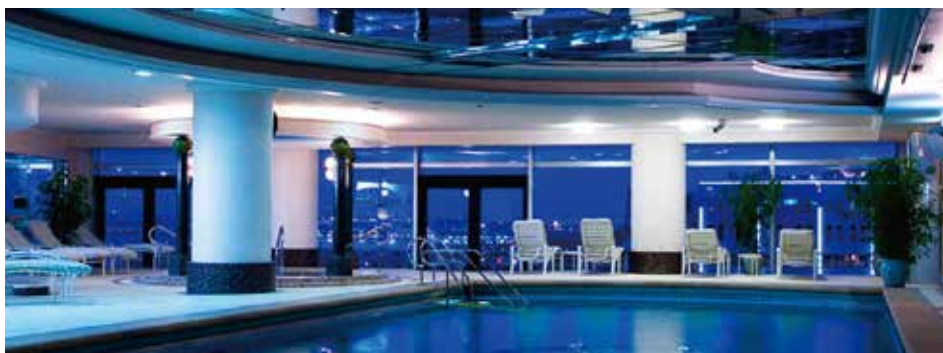
ハーバービュー・フィットネスクラブ

至福のスパトリートメントをお楽しみいただけるスパ「ベイウィンドー」とトレーニングマシンやプール、ジェットバスを完備する「ハーバービュー・フィットネスクラブ」にて、非日常のヒーリングをご体験ください。