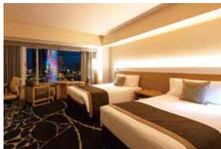
プレミアム (シティビュー)