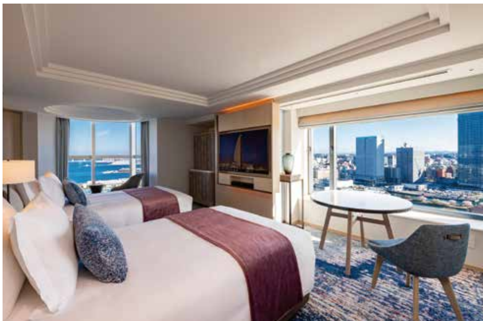
スイート パノラマビュー