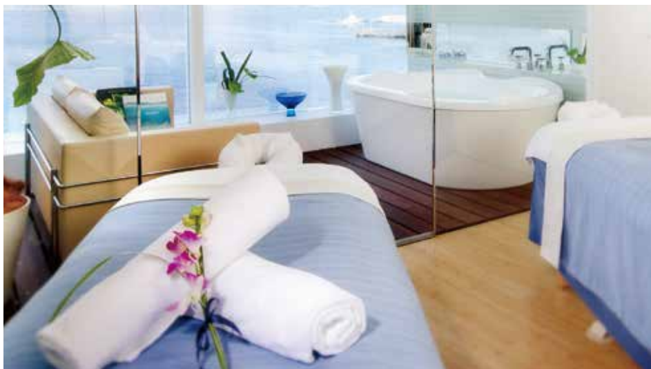
スパ「ベイウィンドー」