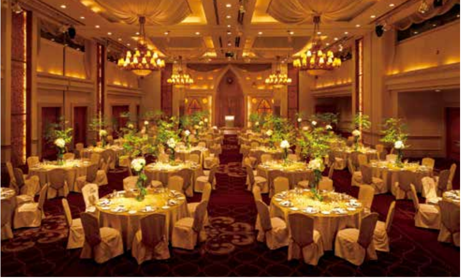
インターコンチネンタル ボールルーム

少人数向けの高級感あふれるダイニングサロンから、横浜港の絶景を独占する開放的な空間、国際会議にも対応するハイエンドな設備を完備した豪華なボールルームまで、多彩な会場をご用意しております。